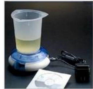
Female, Neurological & Urodynamic Urology